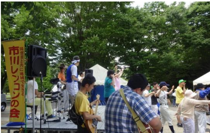
「市川レンコンの会」はステージで楽器演奏