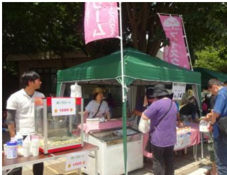
「オリーブハウス」では アイスクリームなどを販売