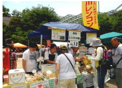
「市川レンコンの会」では ジャムやクッキーを販売