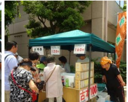
「あやめ」では 古本とドリンクを販売