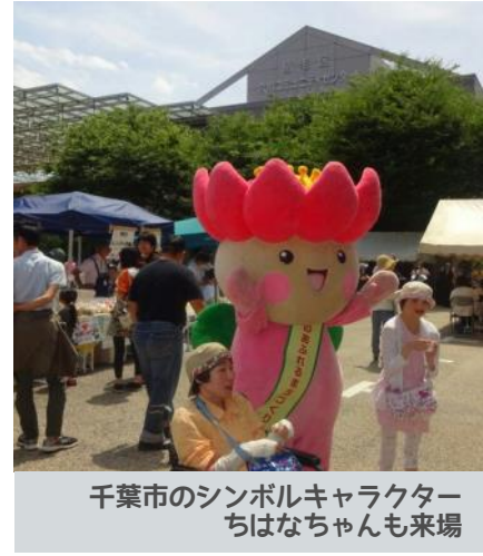
千葉市のシンボルキャラクター ちはなちゃんも来場